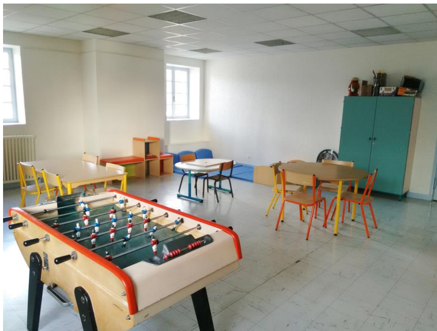
La salle de Jeux

-Une deuxième salle, dénommée « salle de Jeux » attenante à la première, est équipée d'un baby-foot, une table de ping-pong et des tables plus grandes pour jouer aux jeux de société. Un coin lecture avec petit matelas est également aménagé.