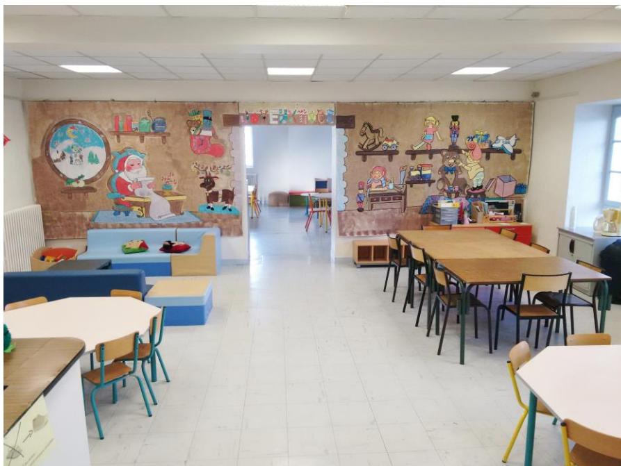
La salle d'Accueil

Des films solaires placés sur les vitres côté cour limitent la chaleur en cas de forte canicule. Une fresque géante « Saisonnière est réalisée par les enfants et les animateurs pour égayer les locaux.