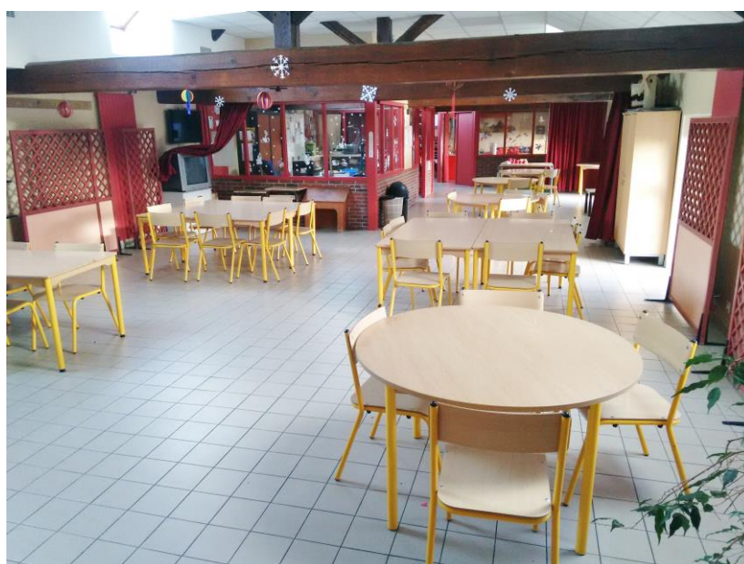
La grande salle

-Puis après avoir monté quelques marches, il y a « la grande salle » avec du matériel Vidéo (lecteur CD, DVD), un grand tableau Velléda et une capacité de 50 places assises permettant l'organisation de grands jeux, de repas et les activités intérieures des Moyens. Nous avons fait équiper de films solaires, les vitres côté sud afin de limiter la chaleur estivale ainsi que des dalles de plafond « réductrices de bruit » pour diminuer les ondes sonores.