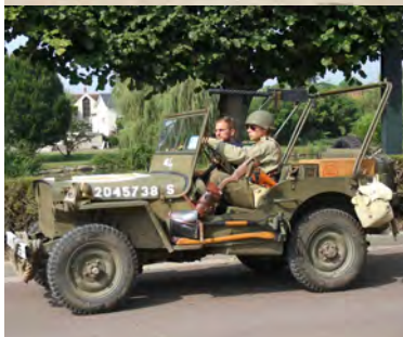
4 - Cérémonie commémorative du 80 e anniversaire de la Libération de Monéteau - 26 août